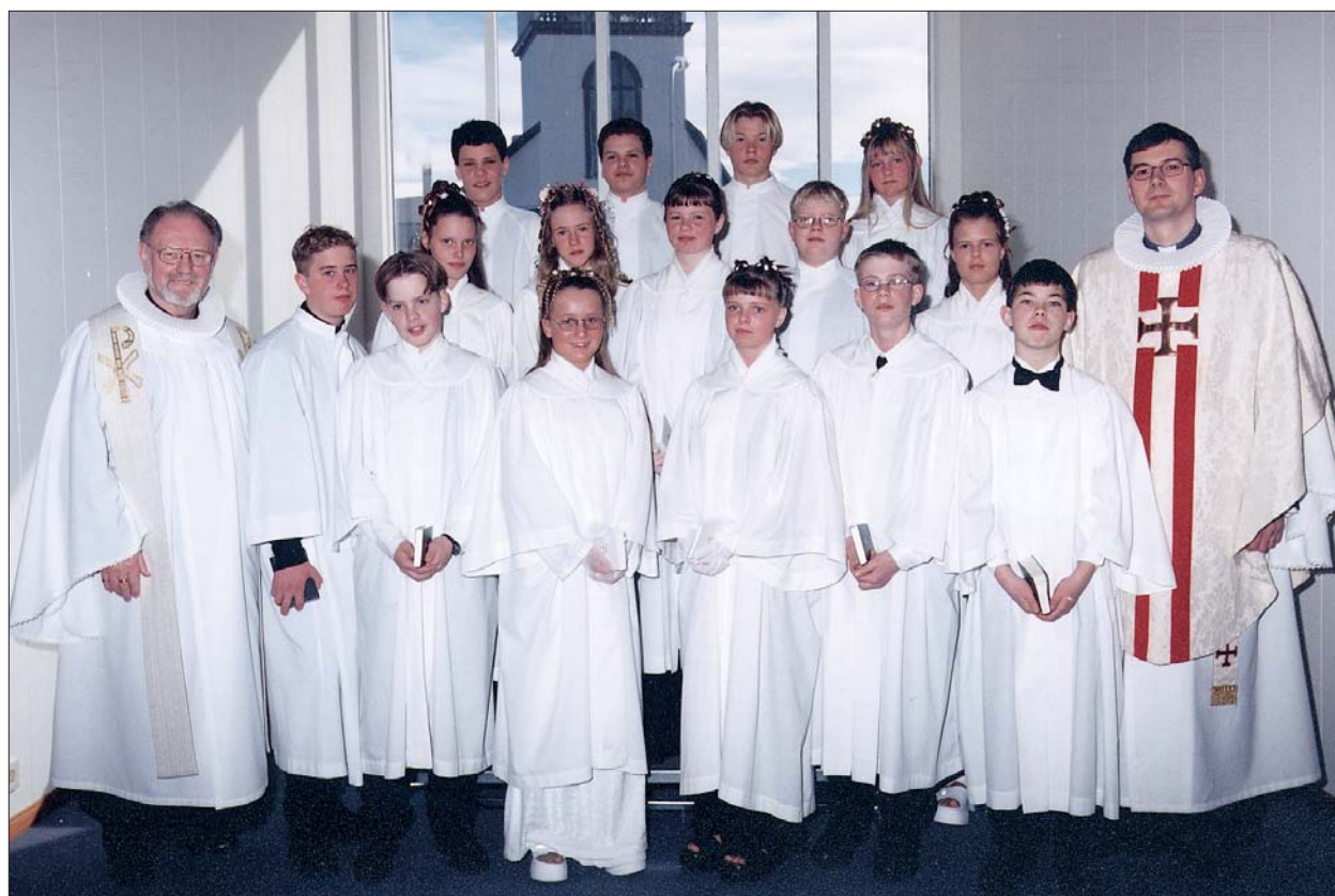
Fermingarbörn í Akraneskirku sunnudaginn 19. apríl 1998 kl. 10:30.