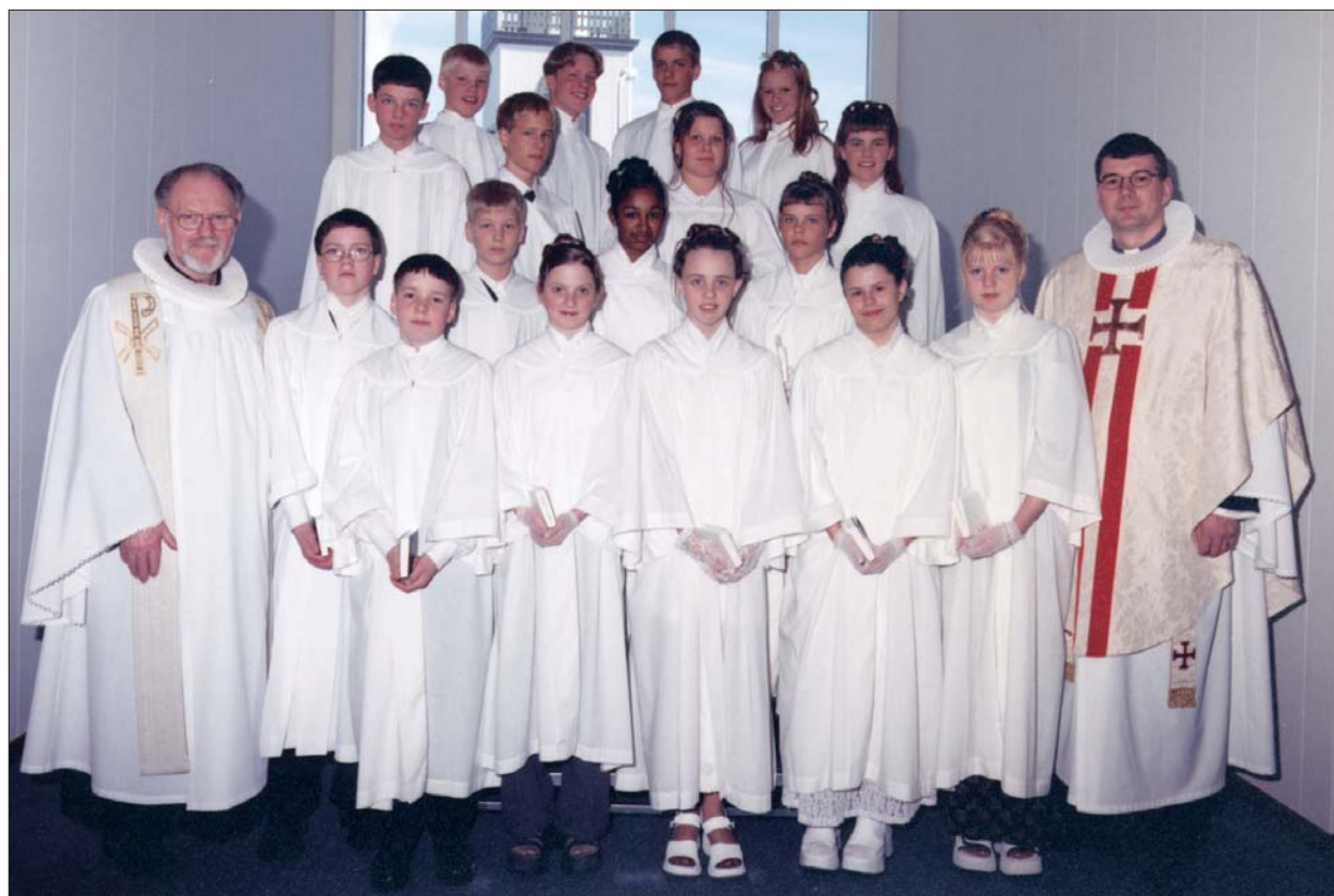
Fermingarbörn í Akraneskirku sunnudaginn 18. apríl 1999 kl. 14.