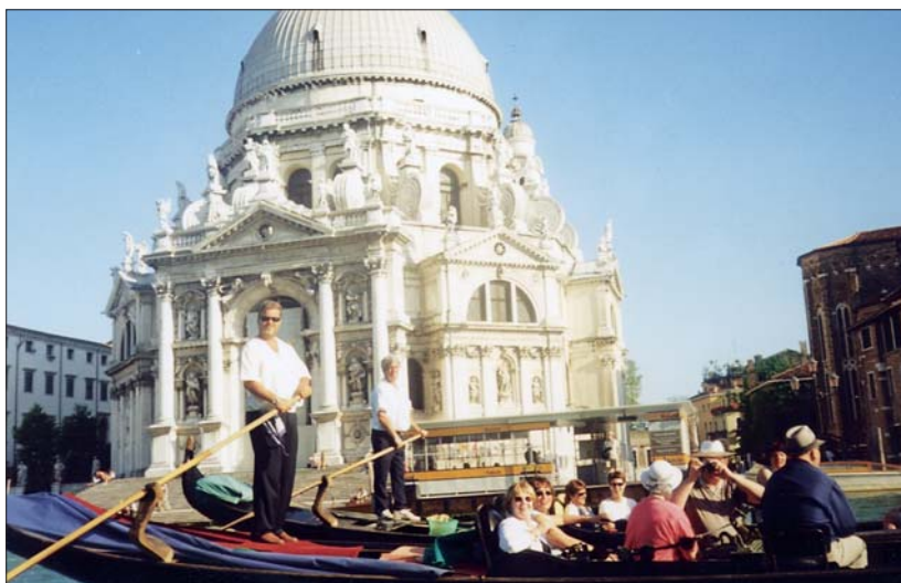
Sigt um síkin í Fenejum.

land undir fót, jafnt innanlands sem utan. Sem dæmi um lönd, sem kórinn hefur haldið tónleika í eða sungið við messur, eru: Ísrael, Pýskaland, Bretland, Ungverjaland, Austurríki og nú síðast Ítalía þar sem kórinn dvaldist 11 daga í fyrra. Tæplega 60 manna hópur fór þangað 3. júní, kórfélagar og makar. Tilgangur fararinnar var að