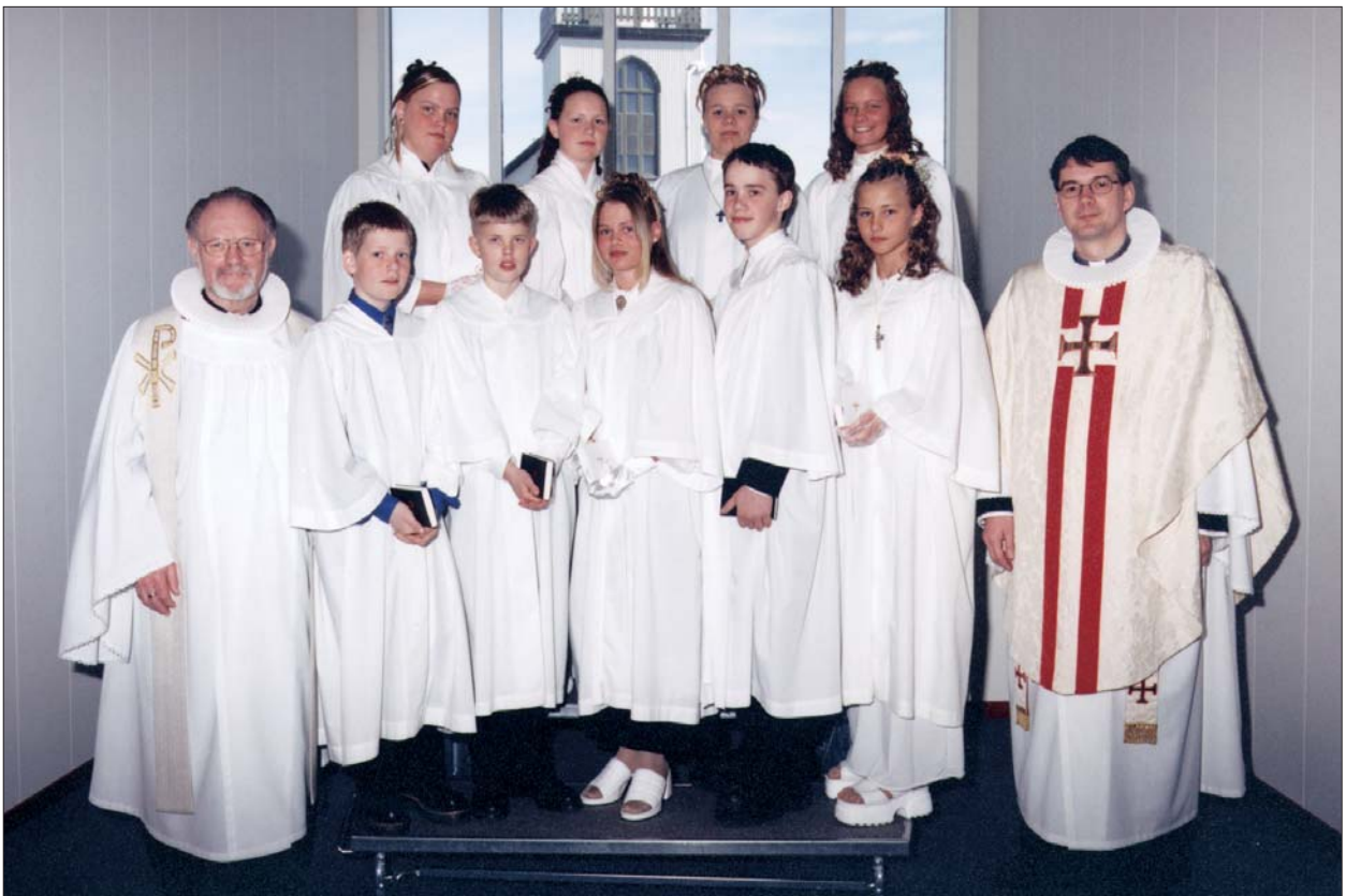
Fermingarbörn í Akraneskirku sunnudaginn 26. apríl 1998 kl. 14.