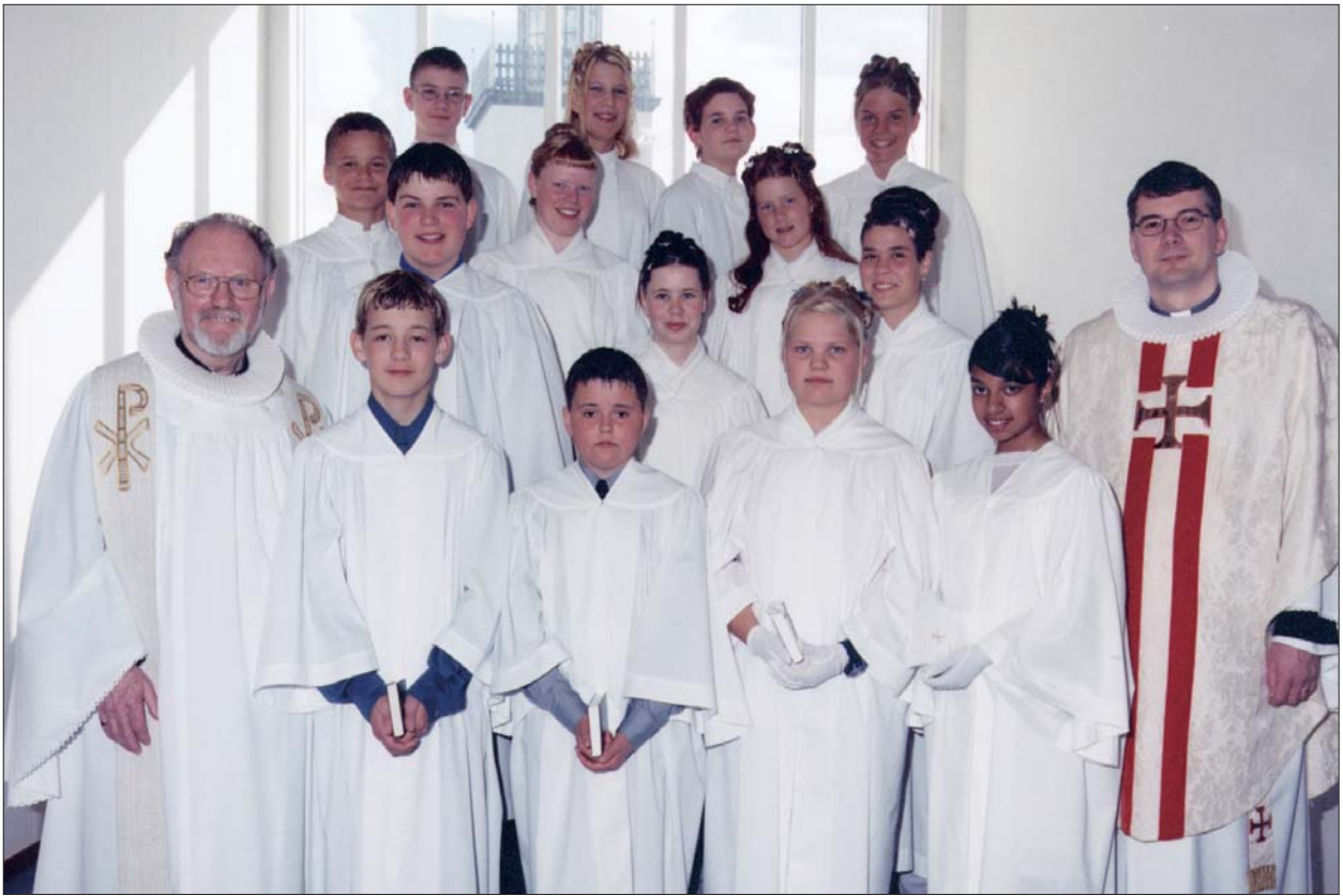
Feringarbörn í Akraneskirku sunnudaginn 25. apríl 1999 kl. 10:30.