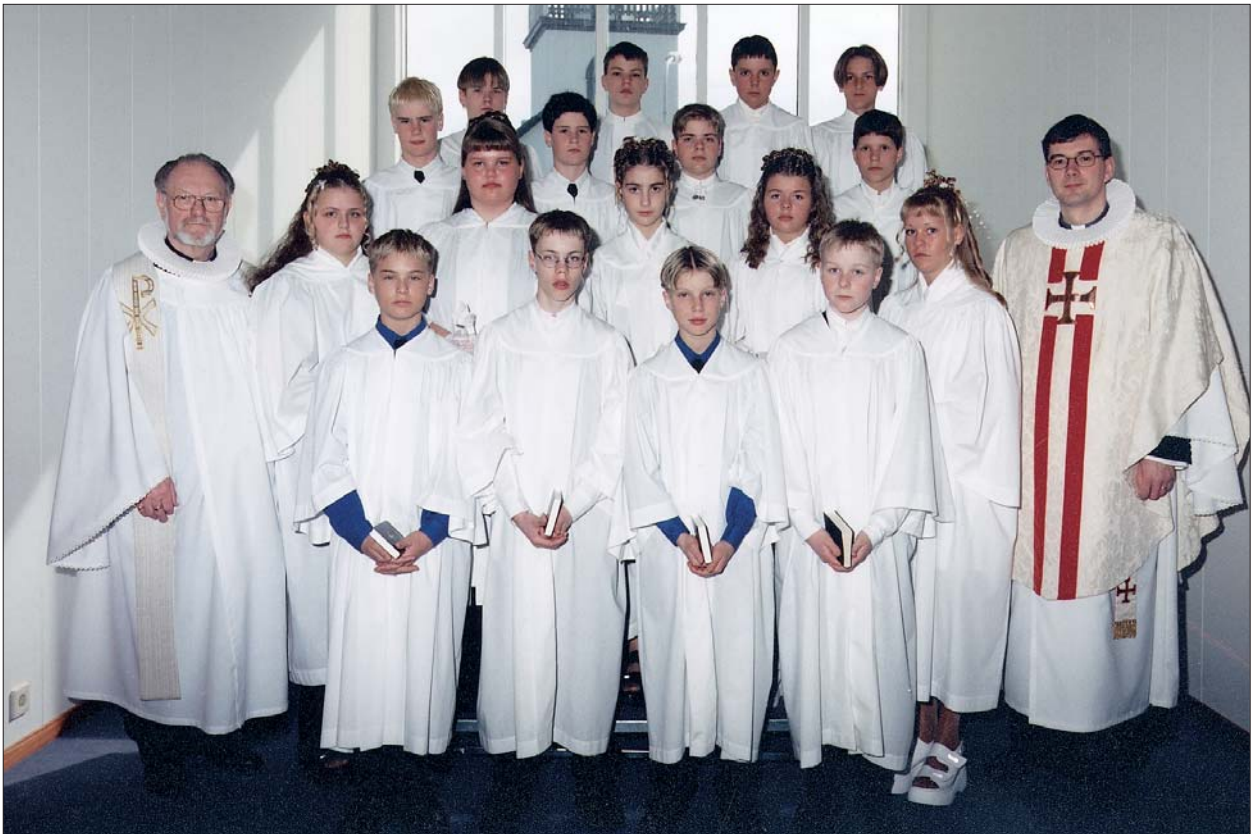
Fermingarbörn í Akraneskirku sunnudaginn 26. apríl 1998 kl. 10:30.