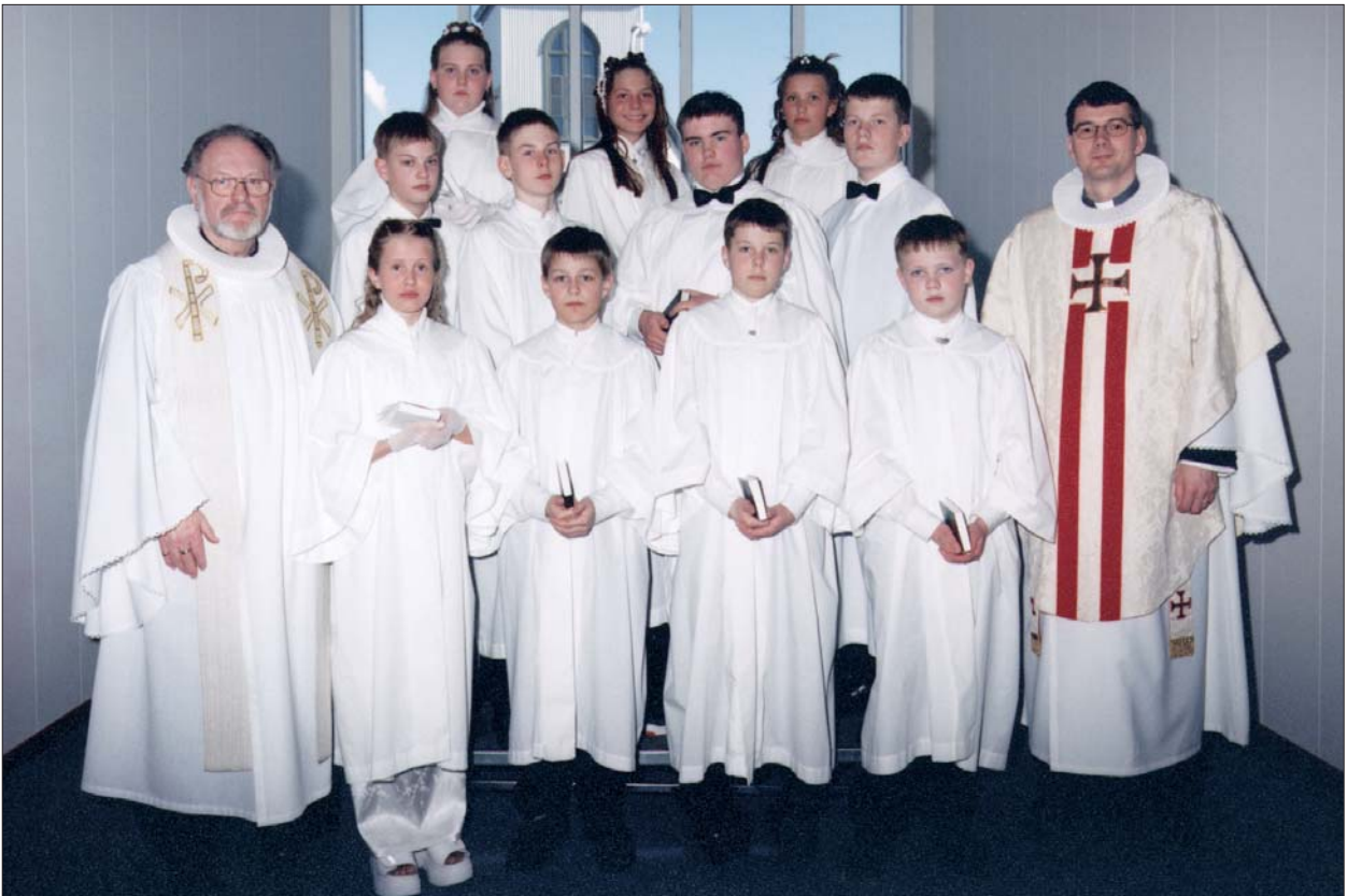
Fermingarbörn í Akraneskirku sunnudaginn 5. apríl 1998 kl. 14.