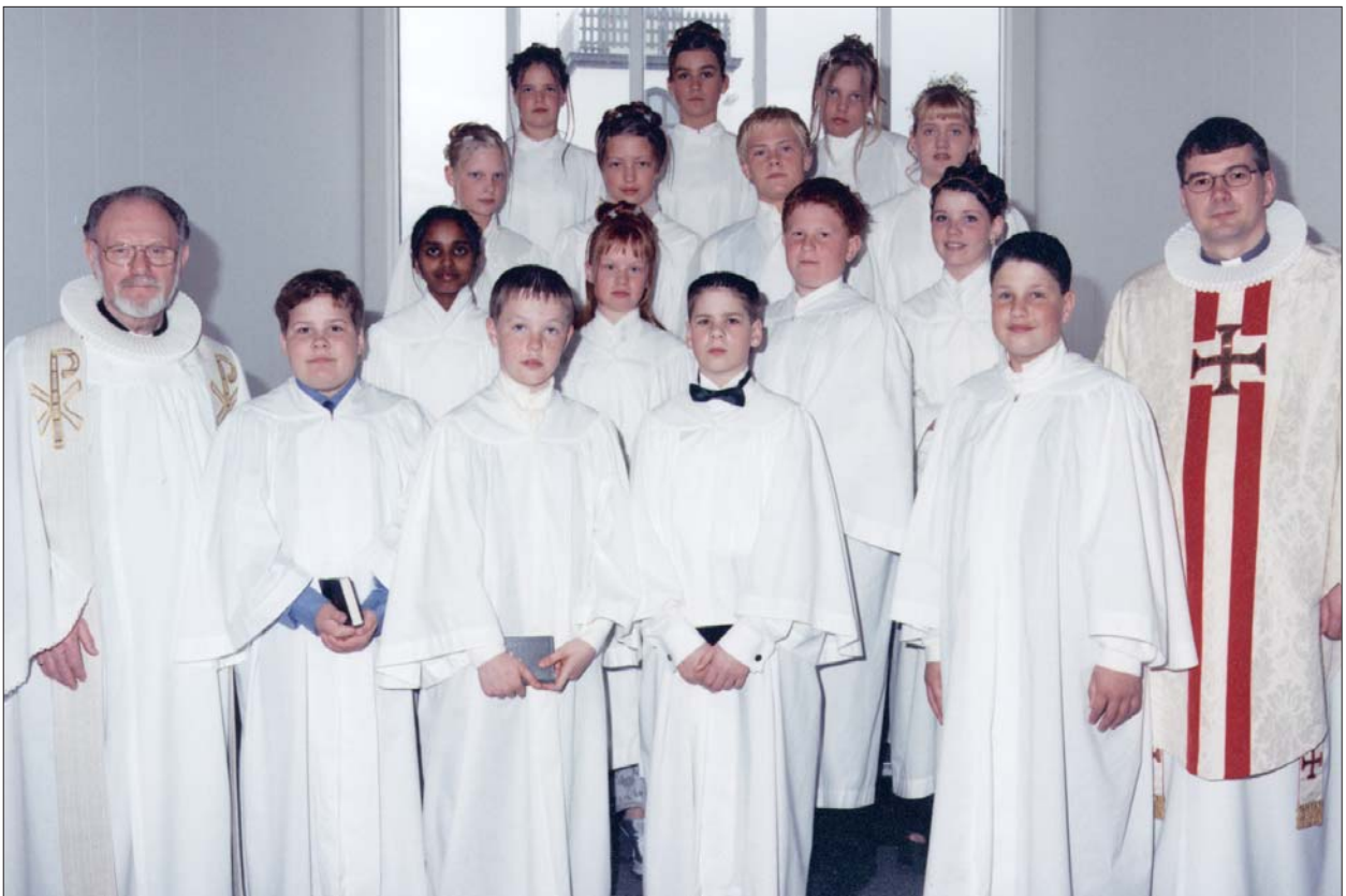
Feringarbörn í Akraneskirku sunnudaginn 25. apríl 1999 kl. 14.