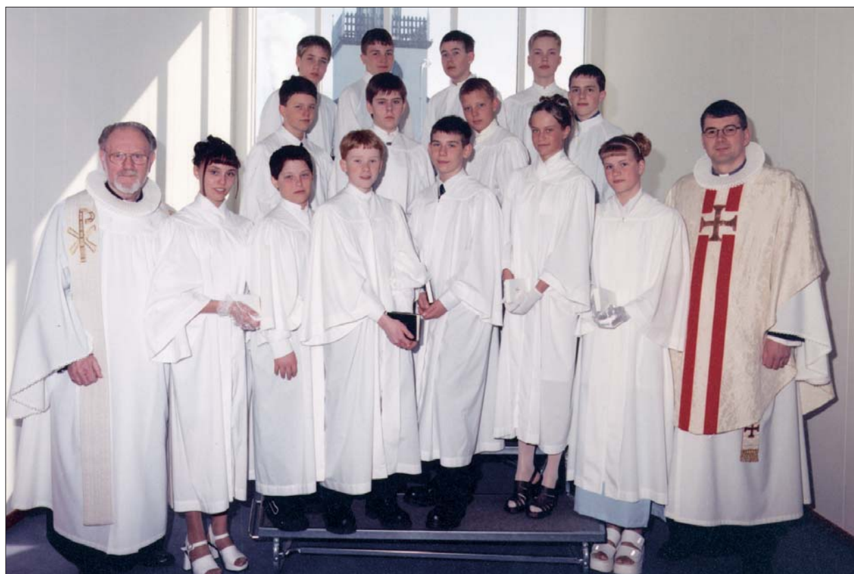
Fermingarbörn í Akraneskirku sunnudaginn 18. apríl 1999 kl. 10:30.