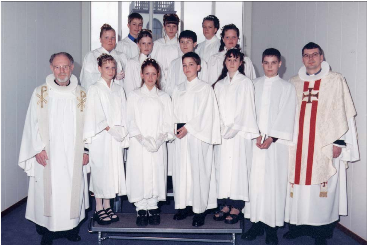
Fermingarbörn í Akraneskirku sunnudaginn 11. apríl 1999 kl. 14.