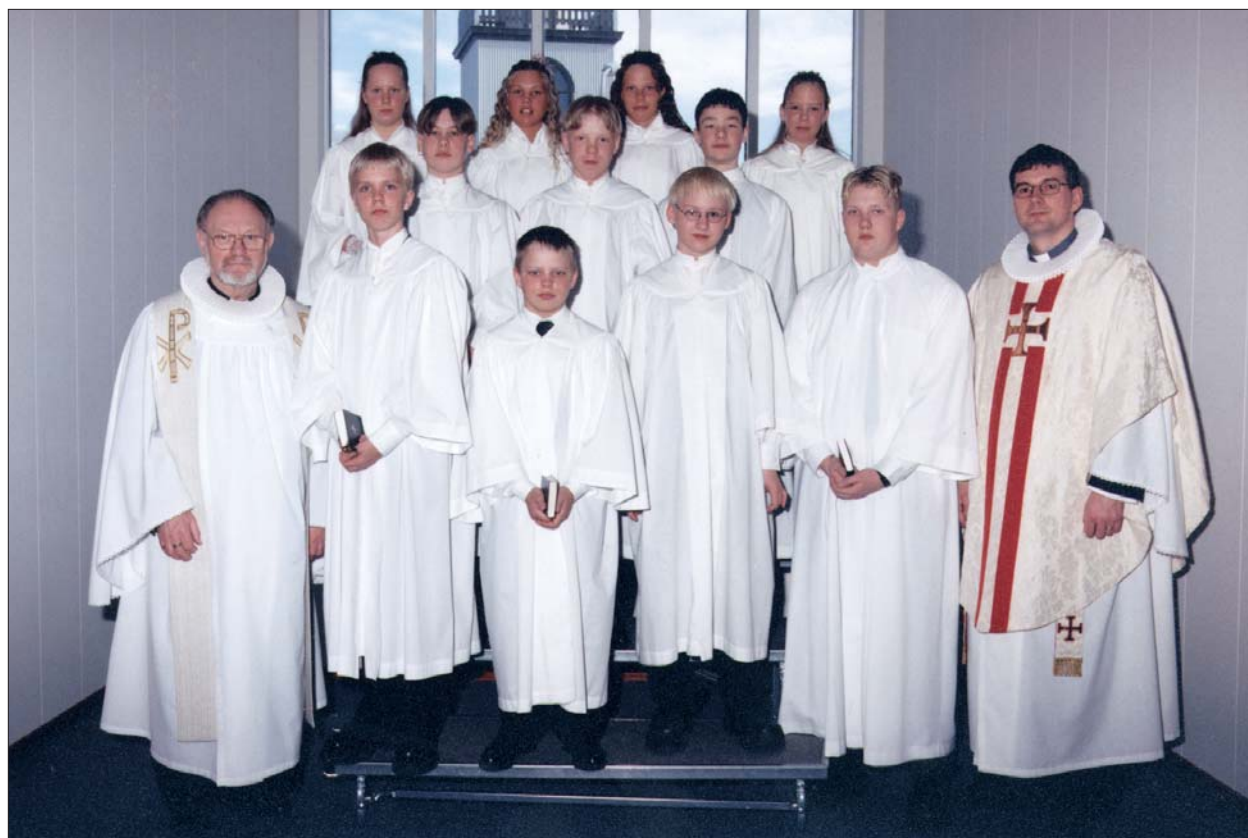
Fermingarbörn í Akraneskirku sunnudaginn 19. apríl 1998 kl. 14.