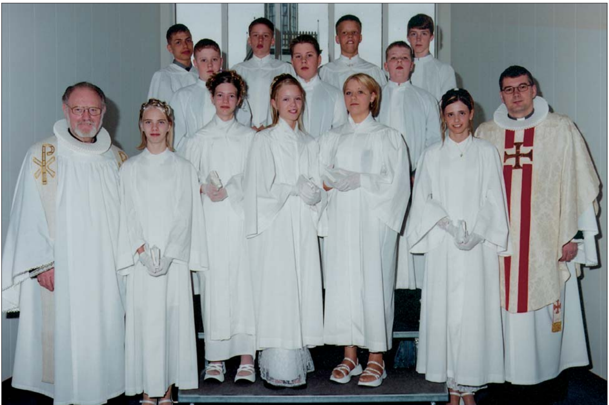
Fermingarbörn í Akraneskirku sunnudaginn 2. apríl 2000 kl. 14.