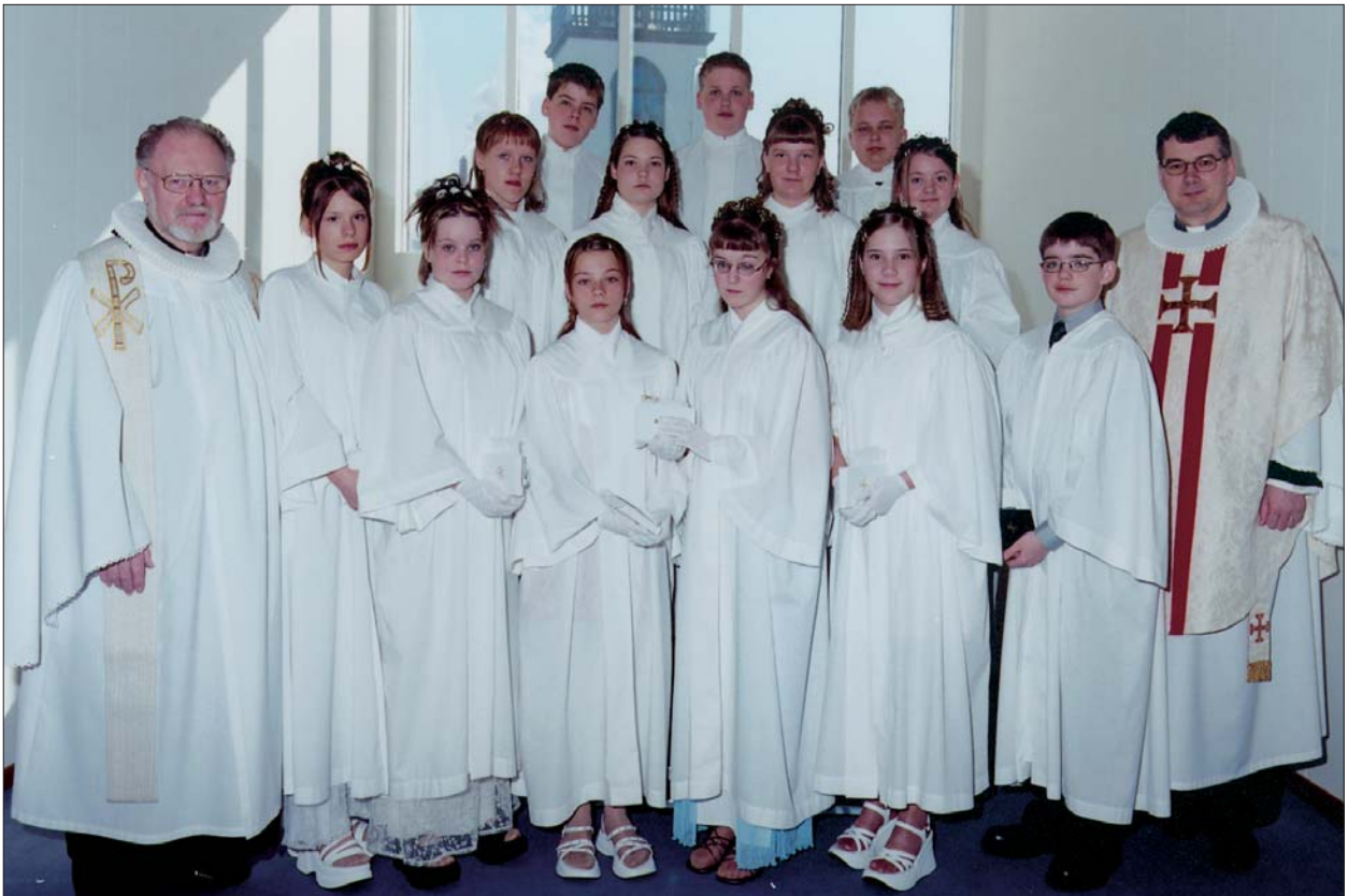
Fermingarbörn í Akraneskirku sunnudaginn 16. apríl 2000 kl. 10:30.