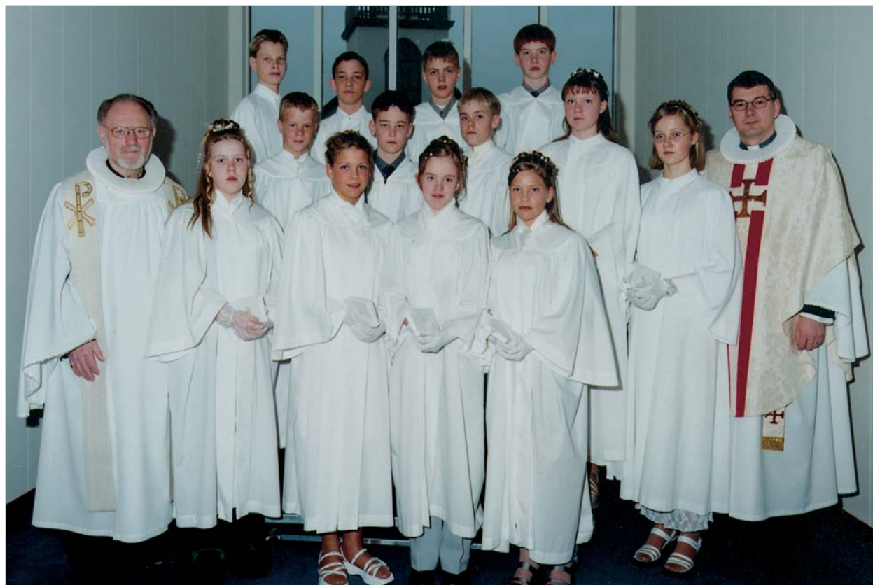
Fermingarbörn í Akraneskirku sunnudaginn 9. apríl 2000 kl. 10:30.