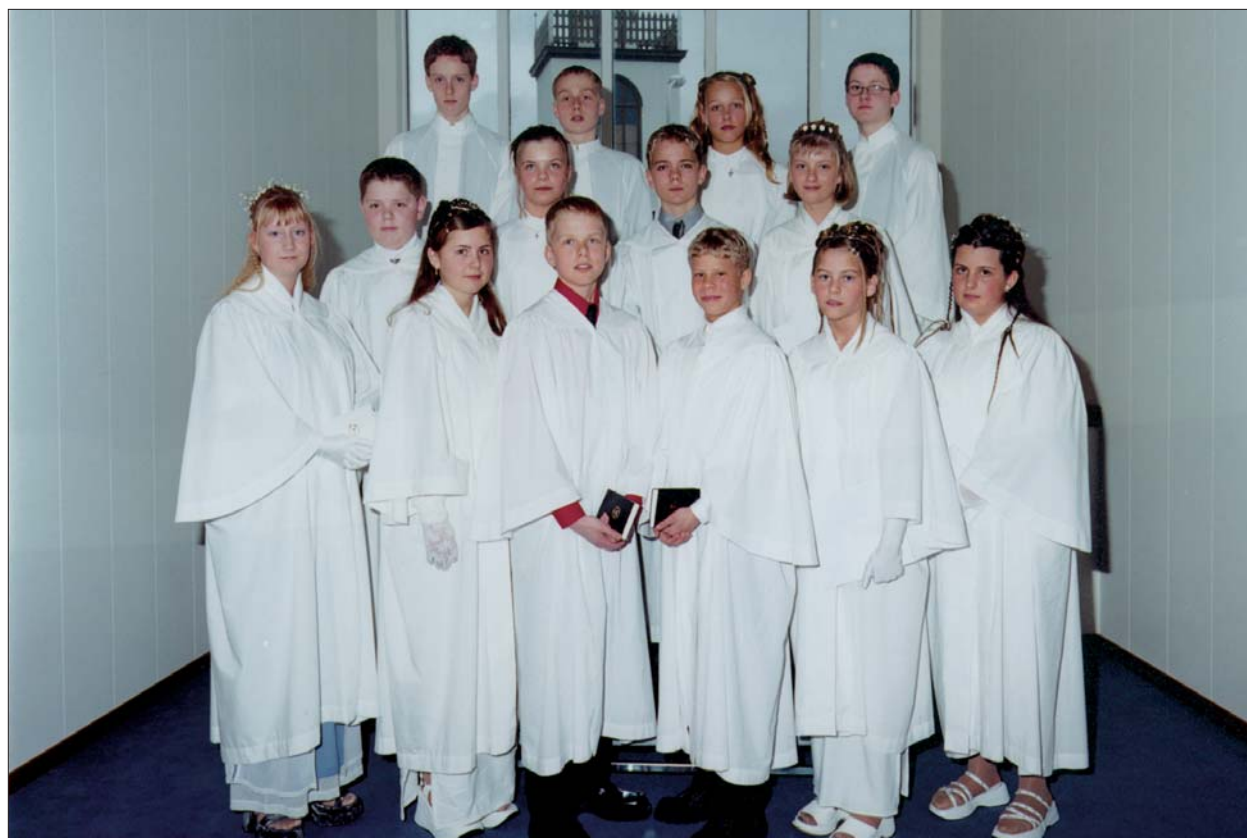
Fermingarbörn í Akraneskirku sunnudaginn 9. apríl 2000 kl. 14.