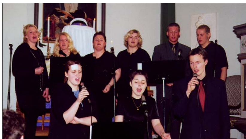
Gospelkórinn í poppmessuni 4. mars.

Engin skýring hefur fengist á þessu vandamáli en böndin berast að gölluðu járn þótt ekki sé hægt að fullyrða neitt um það. Akurnesingar verða því að hafa kirkjuna sína „nakta“ enn um hríð.