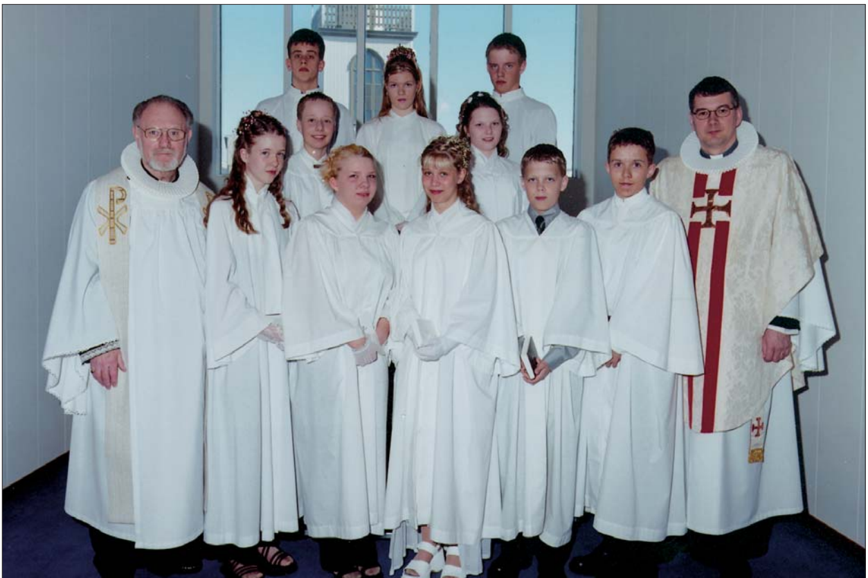
Fermingarbörn í Akraneskirku sunnudaginn 16. apríl 2000 kl. 14.