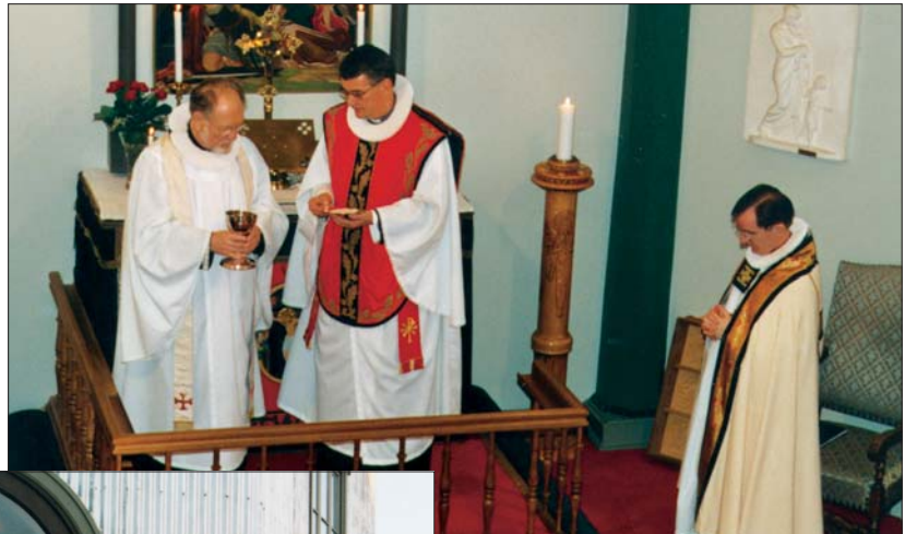
Boðið var til heilagrar kvöldmáltíðar í athöfninni.