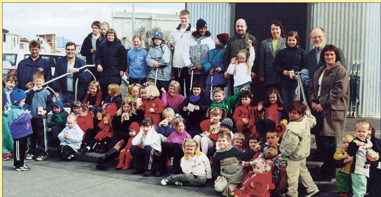
Frá lokahátíð kirkjuskólans vorið 2001.