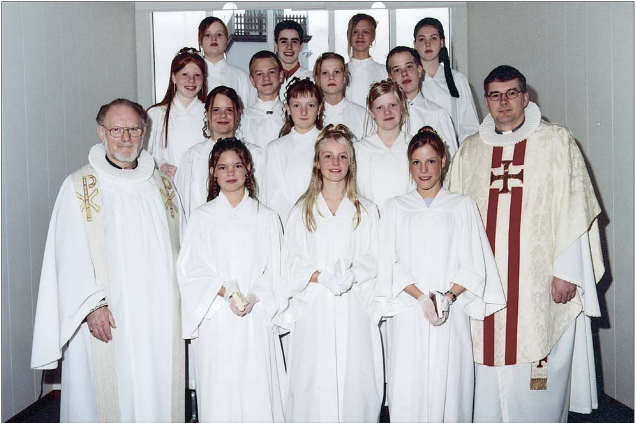
Fermingarbörn í Akraneskirku sunnudaginn 22. apríl 2001 kl. 10:30.