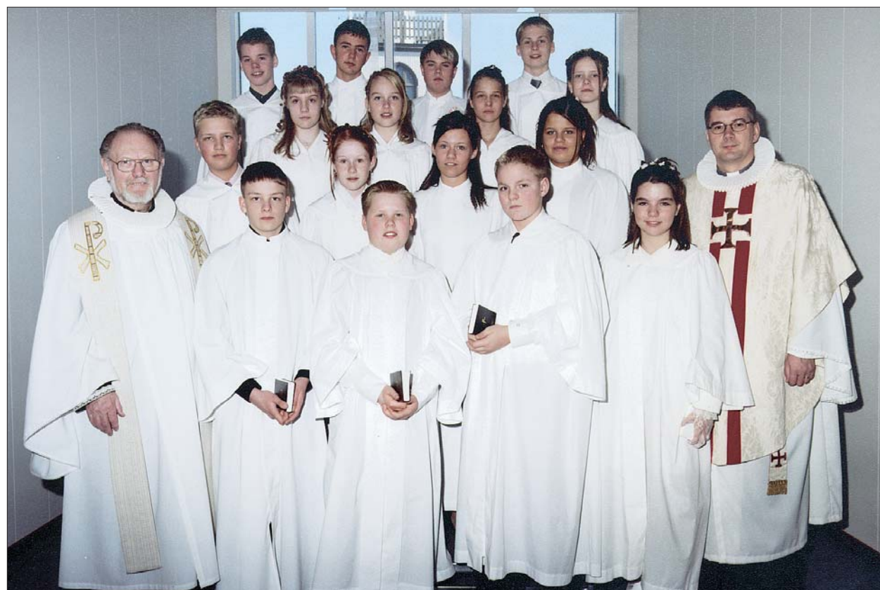
Fermingarbörn í Akraneskirku sunnudaginn 8. apríl 2001 kl. 14.