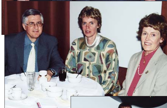
Frá sameiginlegri kvöldstund á Akranesi í fyrra.