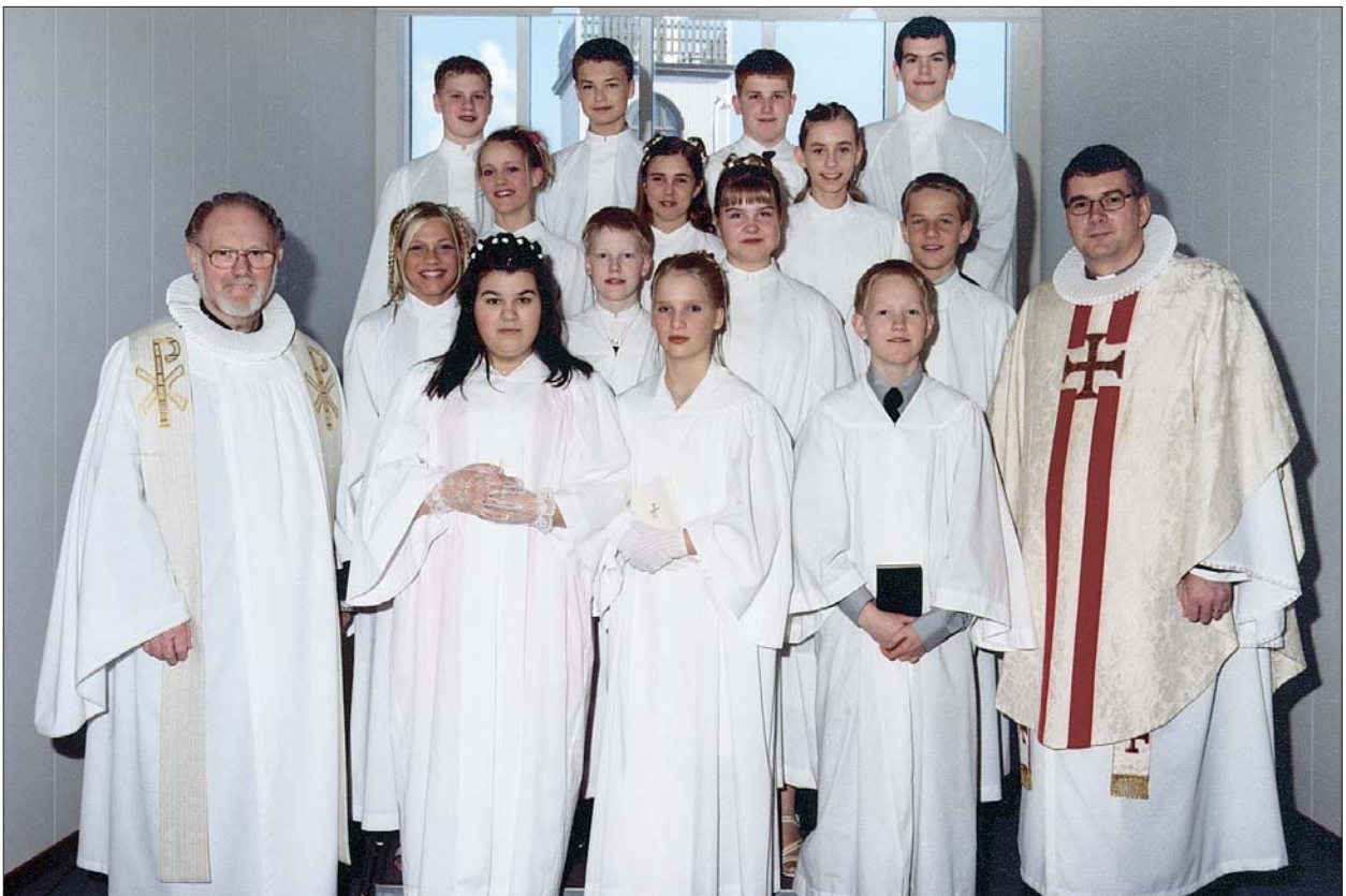
Fermingarbörn í Akraneskirku sunnudaginn 1. apríl 2001 kl. 14.