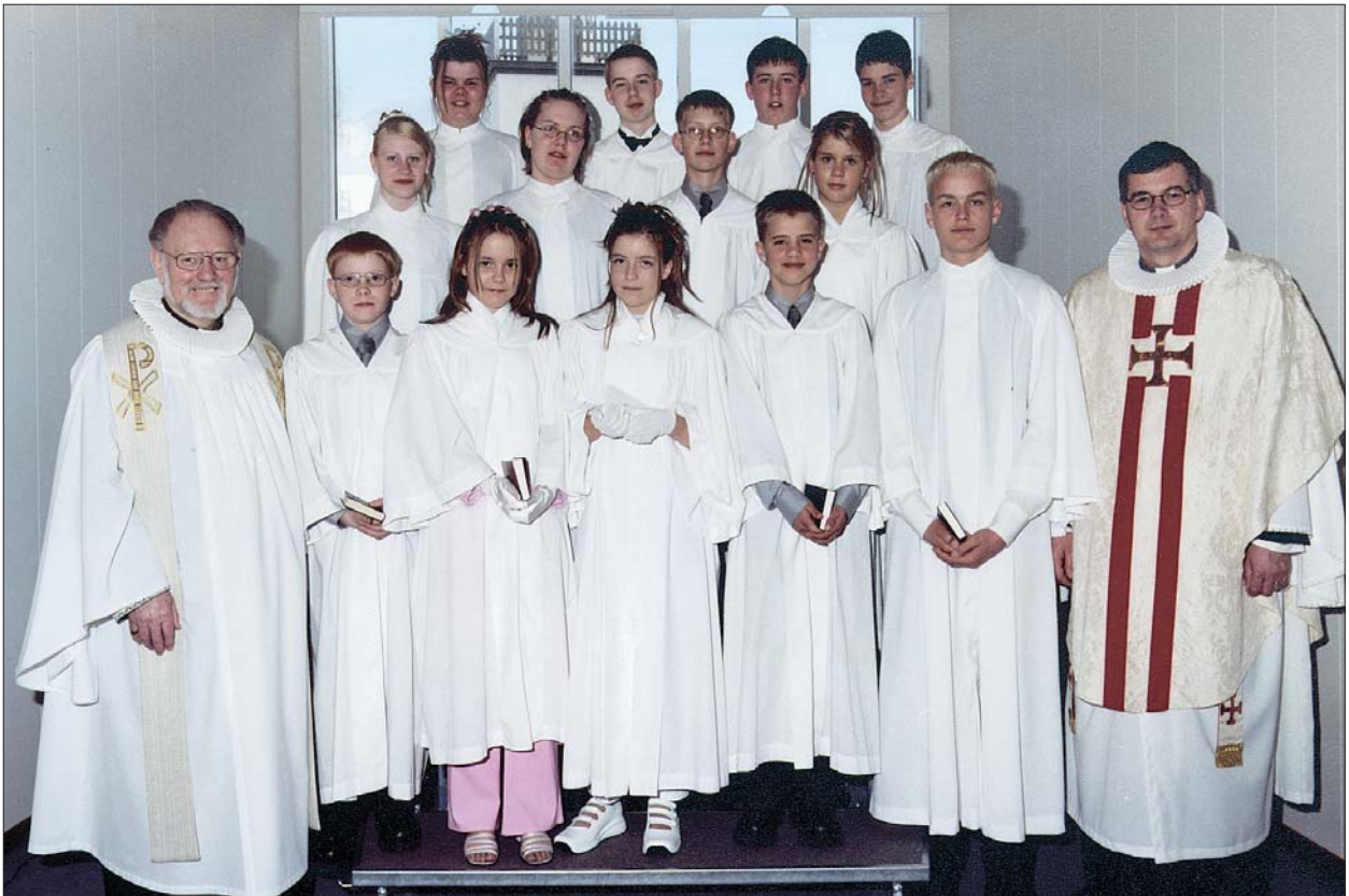
Fermingarbörn í Akraneskirku sunnudaginn 22. apríl 2001 kl. 14.