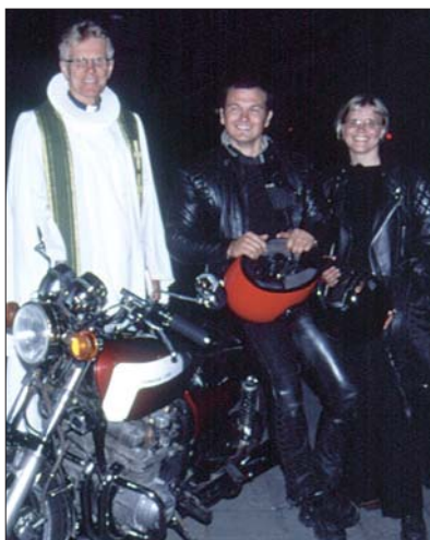
Tveir félagar úr kór Bústaðakirkju komu hingað uppeftir á mótörhjól.