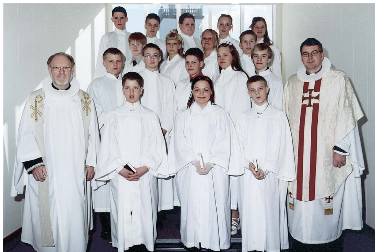
Fermingarbörn í Akraneskirku sunnudaginn 8. apríl 2001 kl. 10:30.