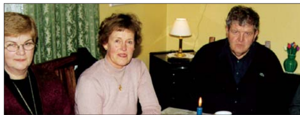
Sex af tju sóknarnefndarmönnum.

Fjöldmörg mál koma til kasta sóknarnefndar Akranes- kirkyja á ári hverju enda er safnaðarstarfið mjög umfangs- mikið - eins og sjá má á efni þessa blaðs. Sóknarnefndarfólk vinnur mjög gott og fórnfúst starf í þágu safnaðarins. (Sjá nafnalista yfir sóknarnefndarfólk á bls. 2).